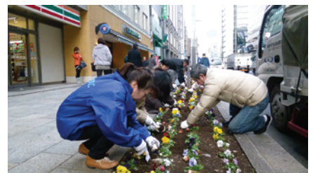
奉行之皆様による球根植え