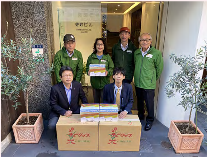
佐藤工業様より直接球根をお届けいただきました

花奉行の佐藤工業株式会社様より富山産チューリップの球根を1,000球、また富山県南砺市からも1,000球の球根をご寄付いただきました。佐藤工業様、富山県南砺市様、いつも誠にありがとうございます。また佐藤工業様からは球根と一緒にワークスーツをリサイクルして作られた“リサイクルフラワーポッド”もお届けいただきました。