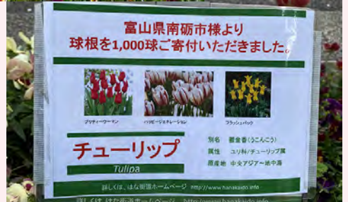
南砺市様よりの昨年寄贈チューリップ花壇の様子