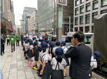
二チニチソウの植え方について説明を聞きます

雨も上がり三年生が初めての花植えに張り切って来てくれました。教わった通りに上手に穴を掘り、植えることができました。最後の水やりも、手のひらに一度水を受けてから優しくあげることができました。