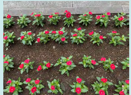
いっぱい咲いてね