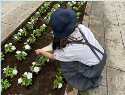
水やりも説明通りに一度手のひらに受けてから優しくあげられました