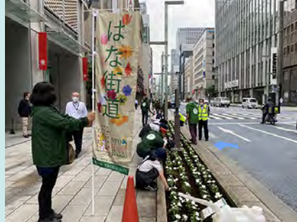
上手に穴を掘り、丁寧に植えることができました